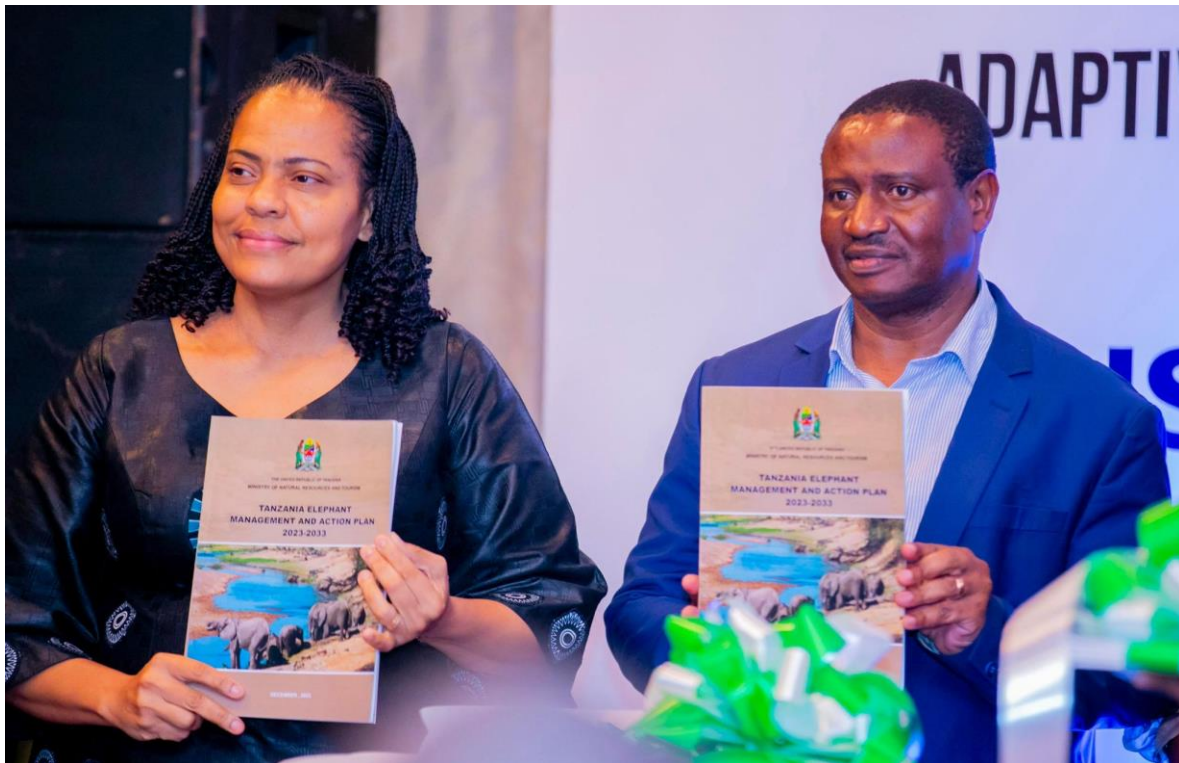
Waziri wa Maliasili na Utalii (kushoto) na Naibu Waziri wa Maliasili na Utalii (kulia) wakati wa uzinduzi wa Mpango wa Usimamizi wa Tembo (2023-2033) Jijini Dar es Salaam.