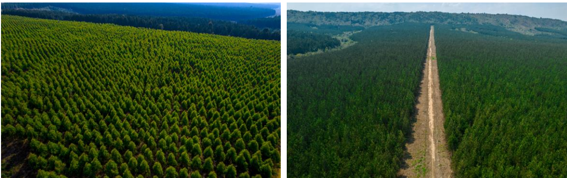
Shughuli za Upandaji Miti na Uhifadhi katika Shamba la Miti Sao Hill, Iringa

123. Mheshimiwa Spika, katika kuhakikisha upatikanaji wa mbegu bora za miti na kufanikisha Kampeni ya Tanzania ya Kijani, Wakala umezalisha jumla ya tani 17.9 za mbegu za miti ya spishi mbalimbali na kukuza miche 34,126,916 ya aina mbalimbali ambayo imepandwa katika mashamba 24 ya Serikali na miche 11,577,802 imegawiwa kwa watu binafsi, Taasisi na Mashirika ya Umma na Taasisi binafsi kwa ajili ya kupandwa katika maeneo yao. Hadi Aprili, 2024 Wakala umepanda miti katika hekta 7,322 na kurudishia miti iliyokufa kwenye hekta 2,038. Aidha, Wakala umeendeleza mashamba ya miti kwa kupalilia hekta 22,330, kupogolea hekta 7,331 na kupunguzia miti kwenye hekta 2,190. Sambamba na hilo, Wakala umeendelea kuhifadhi maeneo ya mikoko kwa kupanda miche 223,777 kwenye eneo la hekta 79.3 katika maeneo ya mwambao wa bahari yaliyopo Kibiti, Tanga, Temeke, Kilwa, Lindi na Bagamoyo.