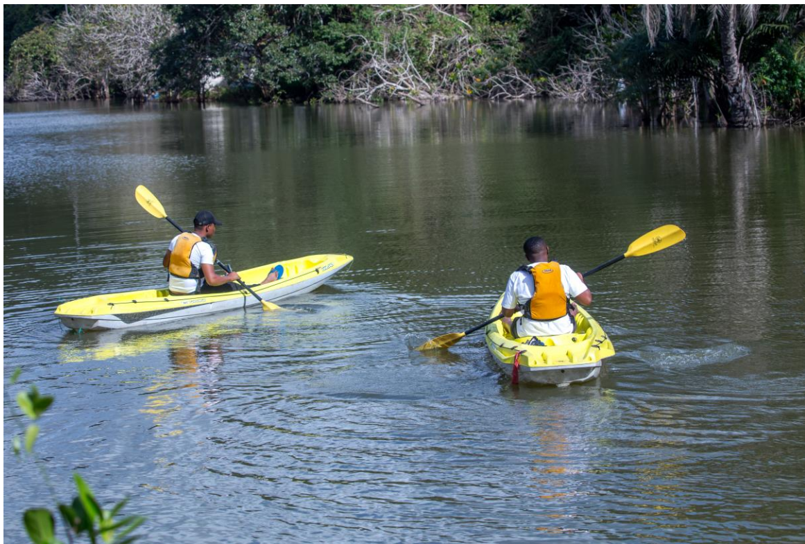
Utalii wa kupiga makasia katika Hifadhi ya Mazingira Asilia Pugu Kazimzumbwi, Dar es Salaam.