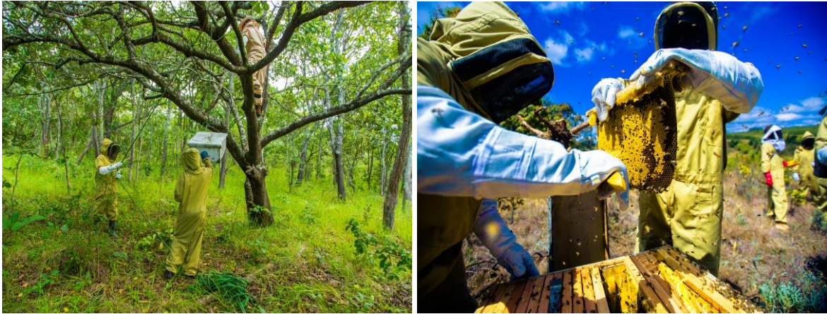
Shughuli za ufugaji nyuki zikiendelea katika Shamba la Nyuki - Wilayani Manyoni, Mkoa wa Singida

129. Mheshimiwa Spika, Wakala umekusanya sampuli 70 za asali kutoka katika Wilaya 34 na kuzipeleka kwenye maabara ya kimataifa iliyopo Nchini Ujerumani kwa lengo la kupima ubora wake. Matokeo yanaonesha kuwa asilimia 96 ya sampuli hizo zimekidhi viwango vya ubora wa kimataifa na hivyo kutoa fursa kwa asali ya Tanzania kuendelea kuuzwa katika masoko mbalimbali duniani yaliyopo Nchi za Ujerumani, Ubelgiji, Uholanzi, Ufaransa, Uingereza, Marekani, Saudi Arabia, Oman, Umoja wa Falme za Kiarabu, Lebanon, Poland, Kenya, Rwanda, Comoro, Botswana na Jamhuri ya Kidemokrasia ya Congo. Aidha, masoko makubwa ya nta ni pamoja na Japan, Marekani, Ujerumani na Poland. Vilevile, Wakala umekamilisha ujenzi na ununuzi wa mitambo ya kiwanda kipyaa cha kuchakata mazao ya nyuki katika Wilaya ya Nzega. Pia, mizinga ya nyuki 916 imezalishwa kupitia viwanda vya Wakala vilivyopo Wilaya za Kondo na Mufindi. Katika kuhamasisha jamii kushiriki katika shughuli za ufugaji nyuki, Wakala umetoa mafunzo ya mbinu bora za ufugaji nyuki kwa vikundi 103 vya ufugaji nyuki vyenye wanachama