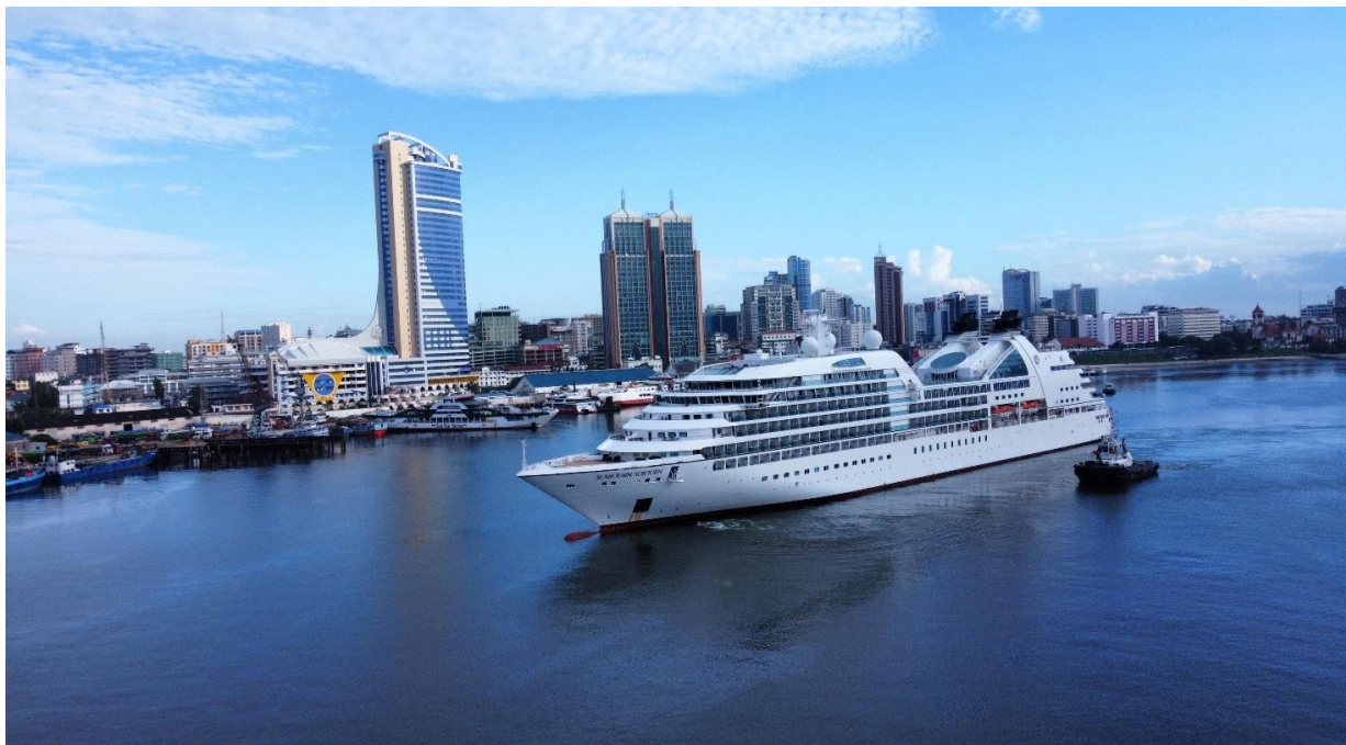
Meli ya watalii ijulikanayo kwa jina la Seabourn Sojourn kutoka Italia ikiwa na Watalii 715 kutoka Mataifa mbalimbali ilipowasili Jijini Dar es Salaam.