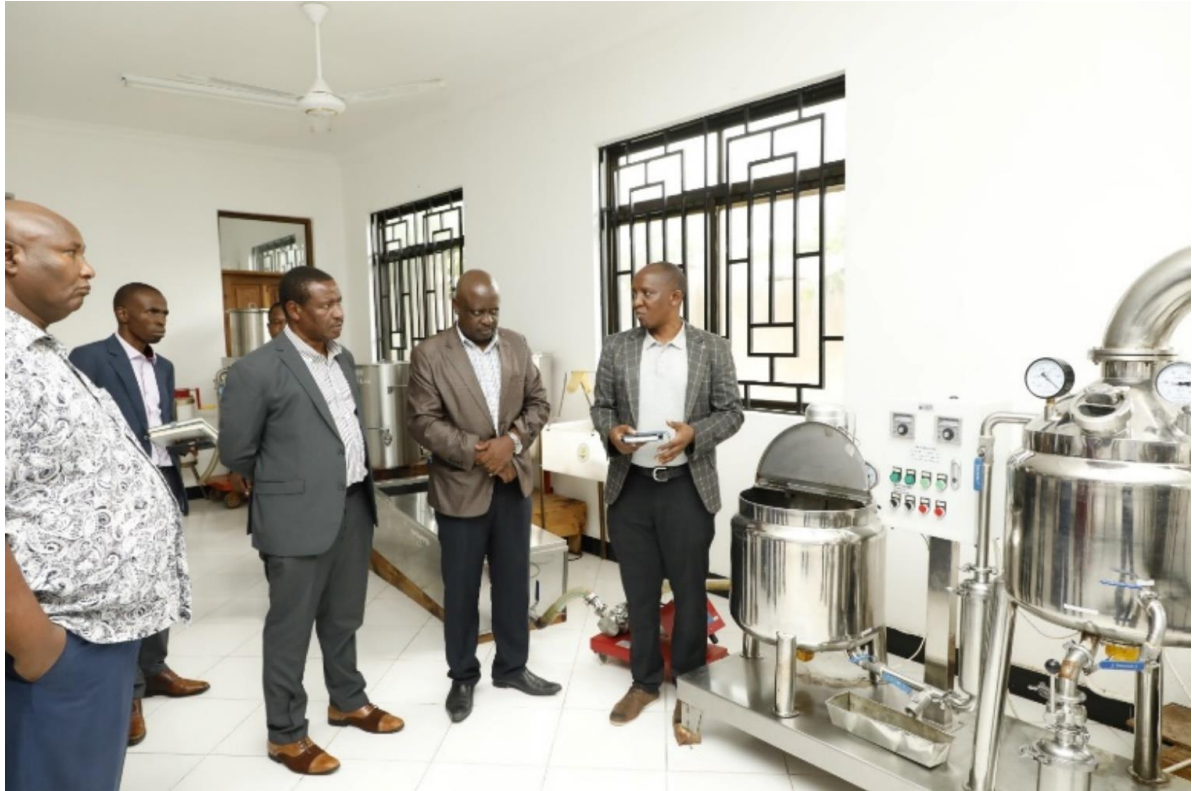
Naibu Waziri wa Maliasili na Utalii, Mhe. Dunstan L. Kitandula (Mb) watatu (kulia) akipewa maelezo kuhusu mtambo wa kuchakata asali katika Chuo cha Ufugaji Nyuki, Tabora (BTI).