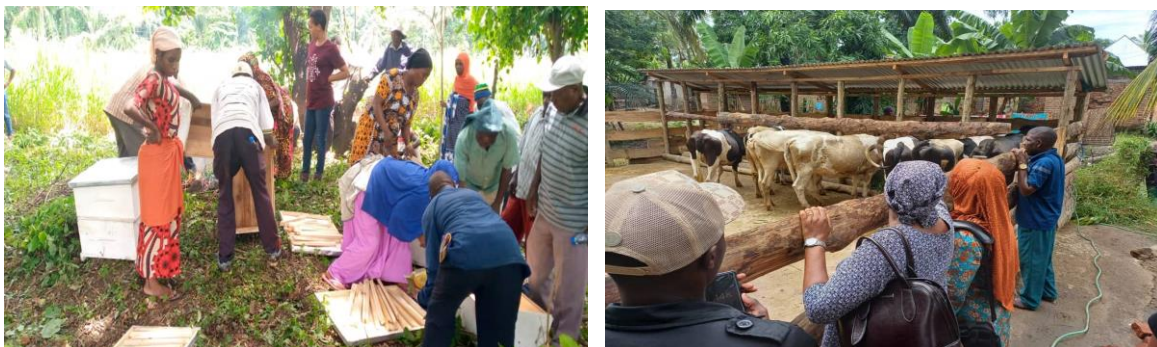
Picha ya kwanza (kushoto) Utayarishaji wa mizinga, mradi wa ufugaji nyuki kikundi cha COCOBA Msufini-Udzungwa. Picha ya pili (kulia) ni mradi wa ufugaji wa ng'ombe wa maziwa kikundi cha Upendo A, Kijiji cha Msolwa Station. Miradi hii ya vikundi vya COCOBA vinafadhiliwa kupitia REGROW.

223. Mheshimiwa Spika, katika uhifadhi wa mazingira, Wizara kupitia mradi wa REGROW imewezesha jumla ya miche ya miti 90,000 kupandwa katika Wilaya za Mufindi (10,000), Mbarali (15,000), Makete (15,000), Wanging'ombe (20,000) na Mbeya (30,000). Miti iliyopandwa imekabidhiwa kwa Jumuiya za Watumia Maji - WUAs, Serikali za Vijiji na Wilaya ili kuhakikisha inakua kama ilivyotarajiwa. Pia, Wizara imewezesha kufukuliwa kwa mito iliyokuwa imepoteza mwelekeo (Mambi kilomita 15 na Kioga kilomita 6) katika Wilaya ya Mbarali. Hatua hiyo imeboresha mtiririko wa maji na kuimarisha shughuli za kilimo na kupunguza siku za kukauka kwa mto kutoka 148 Mwaka 2018 hadi 126 Mwaka 2023. Vilevile, imesaidia kupunguza athari za mafuriko katika Kijiji cha Manienga ambapo zaidi ya kaya 100 zimeondokana na kero ya kuhama wakati wa msimu wa mvua.