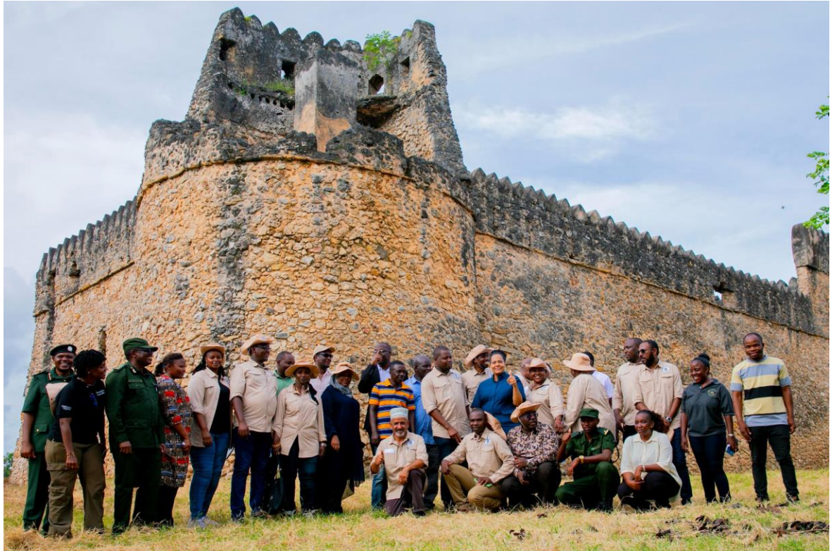
Waziri wa Maliasili na Utalii, Mhe. Angellah Kairuki (Mb) akiwa na Wajumbe wa Kamati ya Kudumu ya Bunge ya Ardhi, Maliasili na Utalii walipotembelea Hifadhi ya Urithi wa Utamaduni wa Dunia ya Magofu ya Kilwa Kisiwani na Songo Mnara.