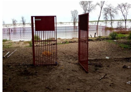
Kizimba kilichoajengwa kwa ajili ya kuzuia mamba kutowadhuru wananchi Ziwa Rukwa katika Halmashauri ya Songwe.

243. Mheshimiwa Spika, Wizara kwa kushirikiana na wadau itawajengea uwezo Askari Wanyamapori wa Vijiji (VGS) 200 kwa ajili ya kukabiliana na matukio ya wanyamapori wakali na waharibifu. Vilevile, Wizara itatoa mafunzo ya mbinu rafiki za kukabiliana na wanyamapori wakali na waharibifu kwa wananchi 320 watakaotumika kama Wakufunzi katika Wilaya 16