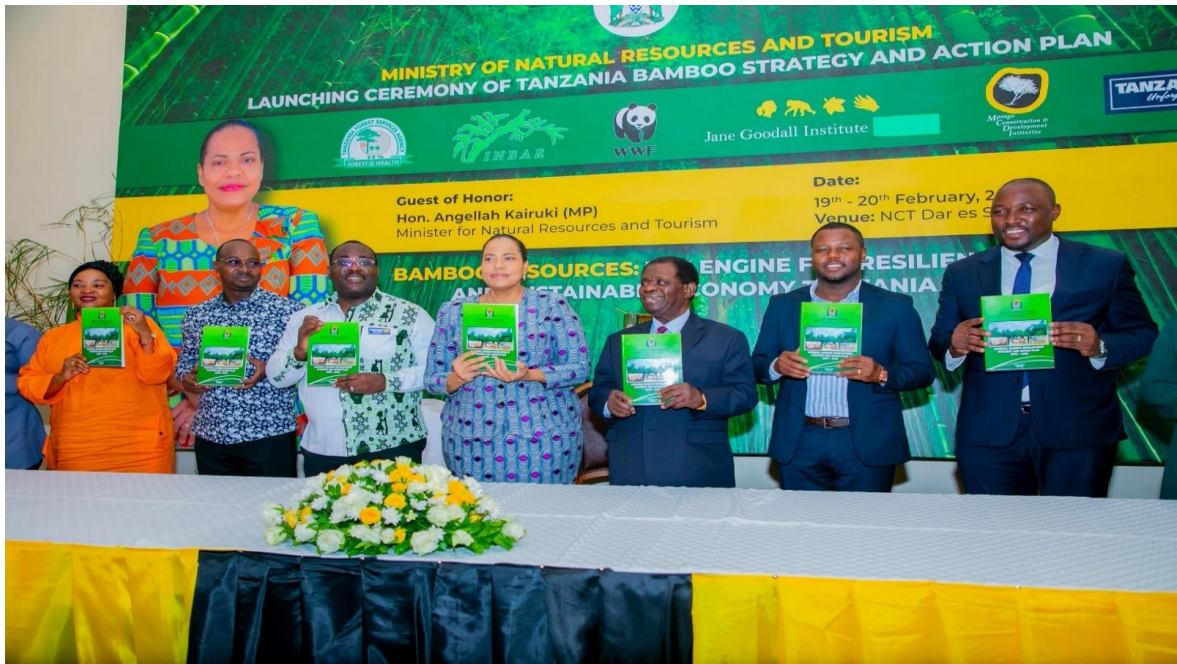
Waziri wa Maliasili na Utalii Mhe. Angellah J. Kairuki (Mb) akizindua Mkakati na Mpango Kazi wa Mianzi katika Chuo cha Taifa cha Utalii Kampasi ya Bustani Jijini Dar es Salaam.