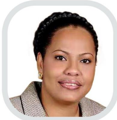
Angellah J. Kairuki (Mb) Waziri Maliasili na Utalii