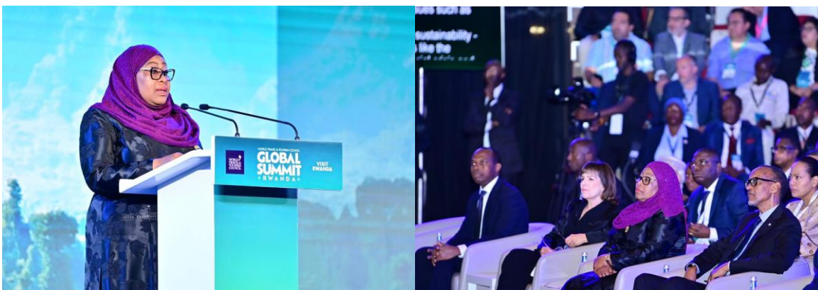
Mheshimiwa Dkt. Samia Suluhu Hassan, Rais wa Jamhuri ya Muungano wa Tanzania akihutubia na kufuatilia matukio katika Mkutano wa WTTC Global Summit uliofanyika Novemba, 2023 Jijini Kigali, Rwanda.

158. Mheshimiwa Spika, Wizara ya Maliasili na Utalii imeendelea kuratibu ushiriki wa Tanzania katika mikutano na matukio ya utalii Kimataifa ikiwemo: Mkutano wa WTTC Global Summit uliofanyika Novemba, 2023 Jijini Kigali, Rwanda; Maadhimisho ya Siku ya Utalii Duniani Septemba, 2023 Jijini Riyadh, Saudi Arabia; Mkutano Mkuu wa 25 wa UN - Tourism uliofanyika Oktoba, 2023 Jijini Samarkand, Uzbekistan na Mkutano wa 66 wa Kamisheni ya Utalii Kanda ya Afrika uliofanyika Agosti, 2023 Nchini Mauritius ambapo Tanzania ilichaguliwa kuwa Makamu Mwenyekiti na Mjumbe wa Kamati Tendaji ya Shirika hilo. Ushiriki wa Tanzania katika matukio hayo ya Kimataifa ulilenga kuwa sehemu ya maamuzi katika chombo hicho muhimu cha utalii Duniani, kufahamu fursa zilizopo katika utalii wa Kimataifa, kuitangaza Tanzania na vivutio vyake, kuvutia uwekezaji katika Sekta ya Utalii, kubadilishana uzoefu katika kukuza Sekta ya Utalii na kuongeza wigo wa fursa za mafunzo mbalimbali kwa wadau wa utalii.