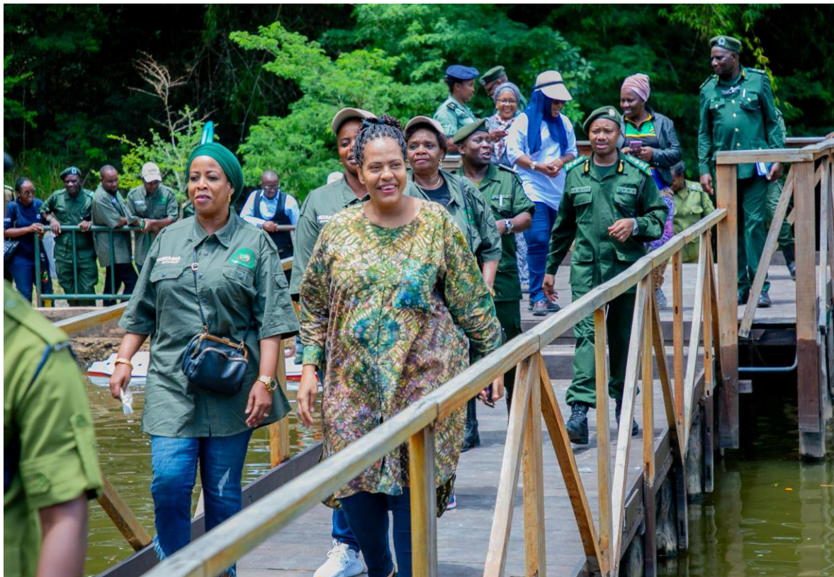
Waziri wa Maliasili na Utalii, Mhe. Angellah Kairuki (Mb) akiwa na Wajumbe wa Kamati ya Kudumu ya Bunge ya Ardhi, Maliasili na Utalii pamoja na Watumishi wa Wizara katika Hifadhi ya Msitu wa Mazingira Asilia Pugu Kazimzumbwi Machi, 2024.