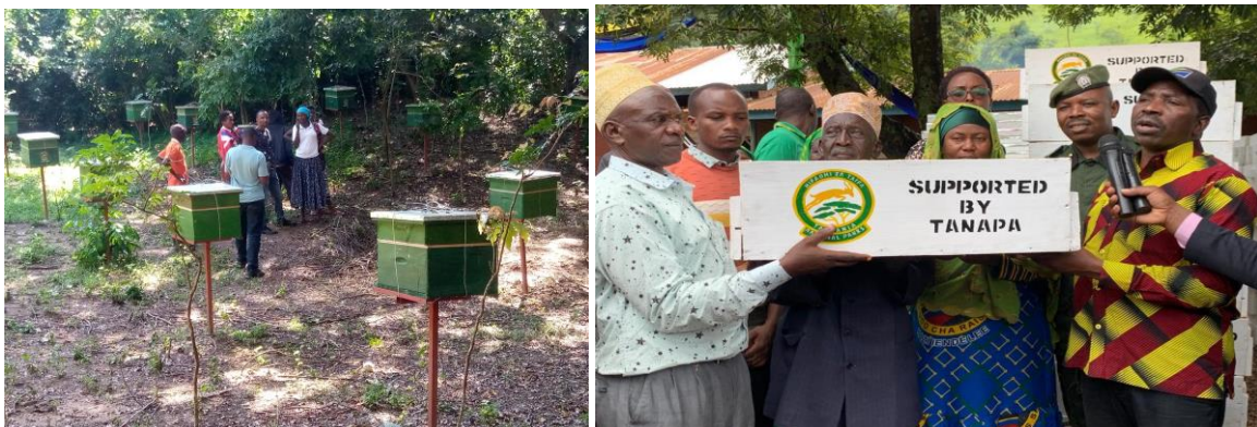
Makabidhiano ya mizinga 25 ya kufugia nyuki kwa kikundi cha "Hapa Kazi" Wilaya ya Bunda na mizinga ya nyuki 200 kwa vikundi 3 vya Wilaya ya Kigoma.

64. Mheshimiwa Spika, sambamba na hilo, Shirika limewezesha Vikundi 166 vya kiuchumi vya jamii katika Wilaya za Chamwino 9, Iringa 25, Kilolo 9, Kilombero 56, Kilosa 15, Mvomero 10, Morogoro 26, Meatu 3, Itilima 9 na Busega 4. Aidha, jumla ya Shilingi bilioni 3.22 zimetolewa kwa vikundi husika kwa lengo la kuvisaidia kuimarika kiuchumi ili kuweza kujiendesha na kupunguza utegemezi wa rasilimali za wanyamapori na misitu. Vilevile, vikundi 16 vya Wilaya za Itilima 9, Meatu 3 na Busega 4 vilipatiwa jumla ya mizinga ya nyuki 300 pamoja na vifaa vingine vikiwemo mavazi ya kinga 60, vifaa vya ukaguzi (bee smoker-75, honey filter-15 na tool hives-60), vifaa vya uchakataji mazao (bee pressing machine-15) pamoja na ndoo 300 za kutunzia asali.