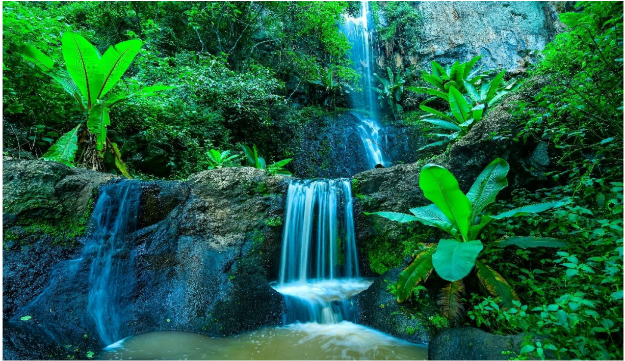
Maporomoko ya maji ya Endoro yaliyopo Eneo la Hifadhi ya Ngorongoro katika Wilaya ya Ngorongoro.